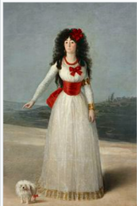
La duquesa de Alba, 1795 (colección Casa de Alba, palacio de Liria, Madrid).

La evolución que experimentó el retrato masculino se observa si se compara el Retrato del Conde de Floridablanca de 1783 con el de Jovellanos , pintado en las postrimerías del siglo. El retrato de Carlos III que preside la escena, la actitud de súbdito agradecido del autorretratado pintor, 127 la lujosa indumentaria y los atributos de poder del ministro e incluso el tamaño excesivo de su figura contrastan con el gesto melancólico de su colega en el cargo Jovellanos. Sin peluca, inclinado y hasta apesadumbrado por la dificultad de llevar a cabo las reformas que preveía, y situado en un espacio más confortable e íntimo, este último lienzo muestra sobradamente el camino recorrido en estos años.