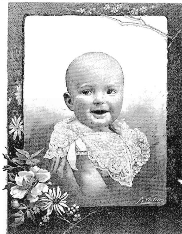
S. M. el Rey D. Alfonso XIII de Borbón y de Hapsburgo-Lorena NACIÓ EN 17 DE MAYO DE 1886