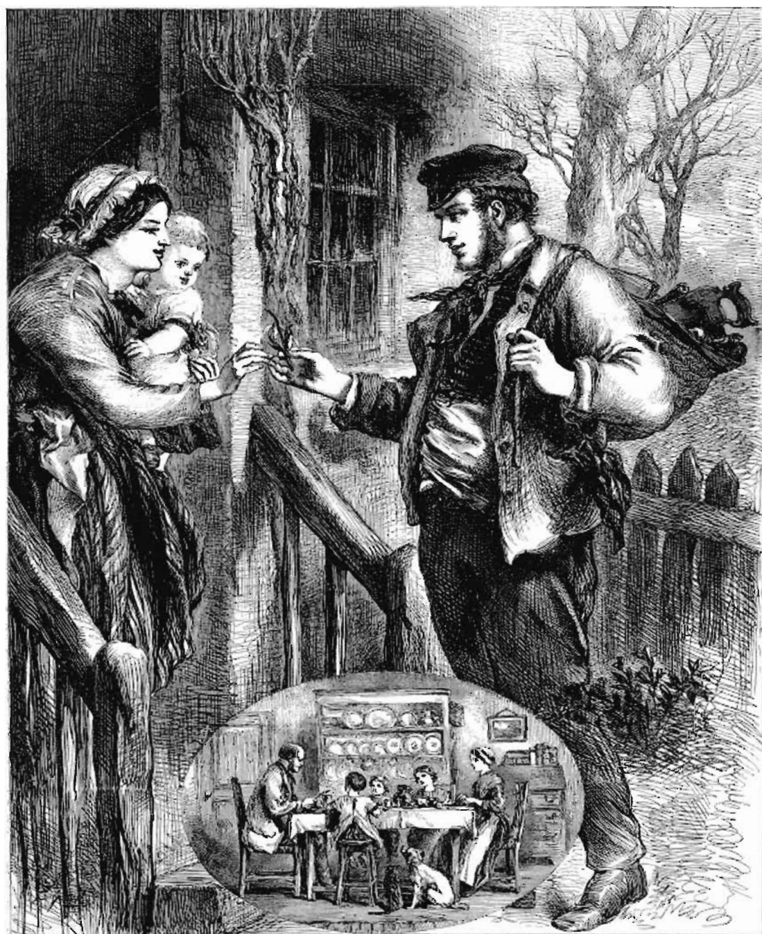
UN MODELO DE OBRERO.