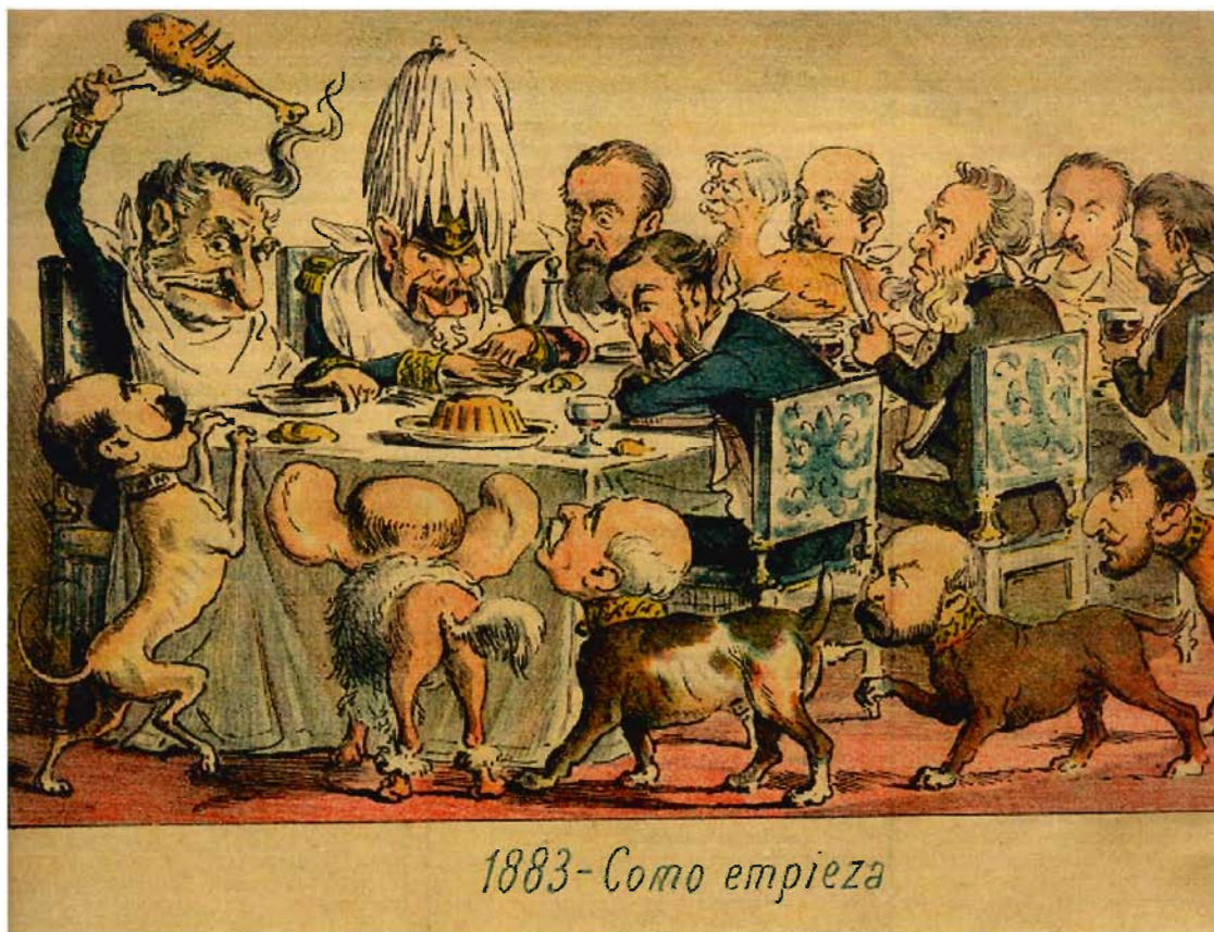
El Loro, sábado 24 de diciembre de 1883