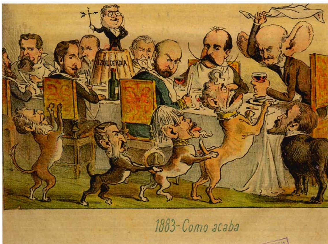
El Loro, sábado 24 de diciembre de 1883 Almanaque para 1884