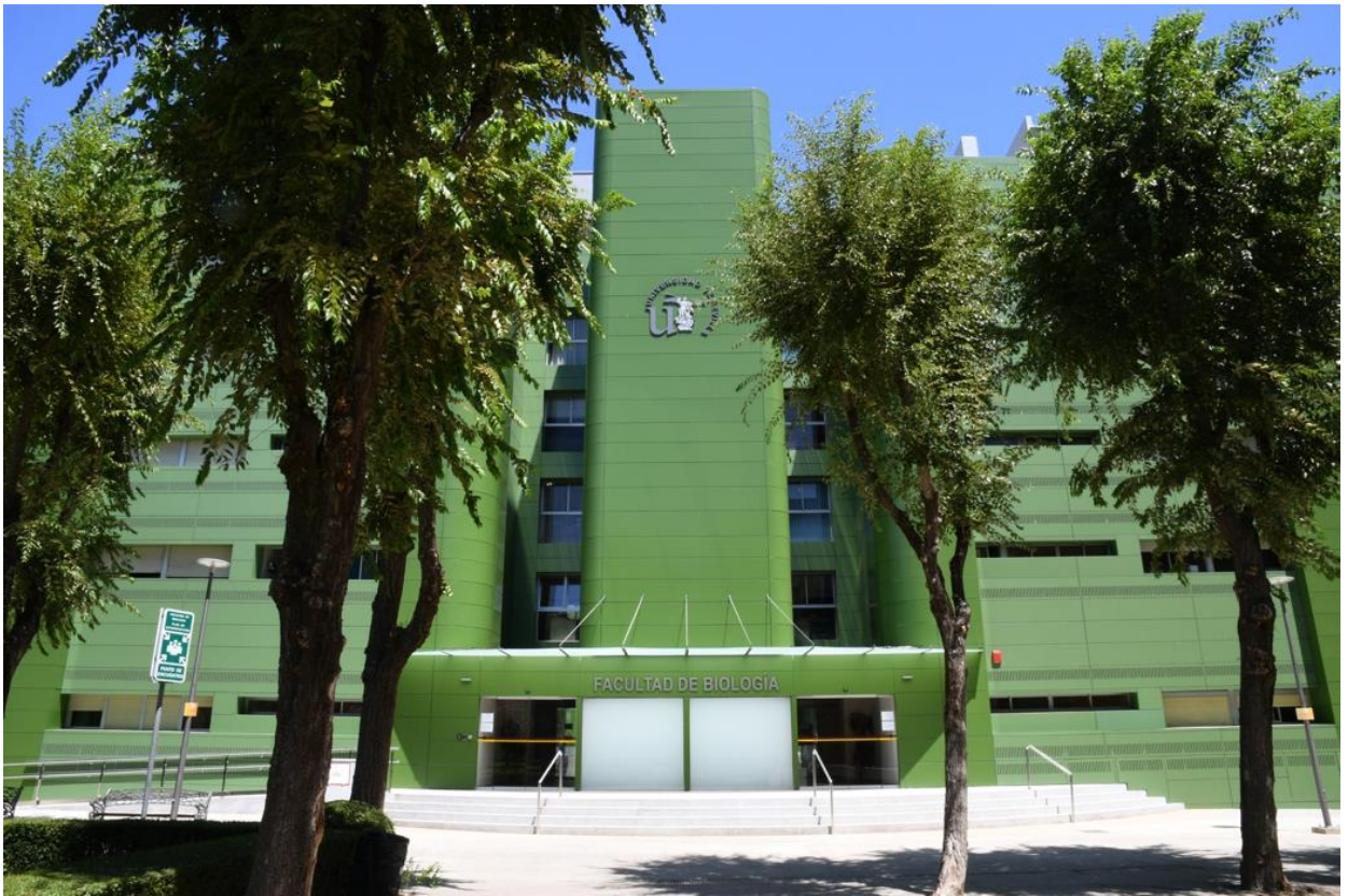
Edificio Verde de la Facultad de Biología de la Universidad de Sevilla